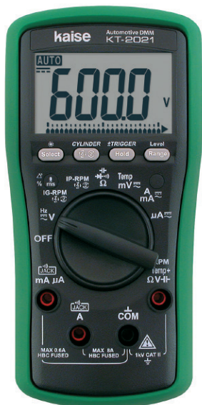
KT-2021 デジタルサーキットテスター