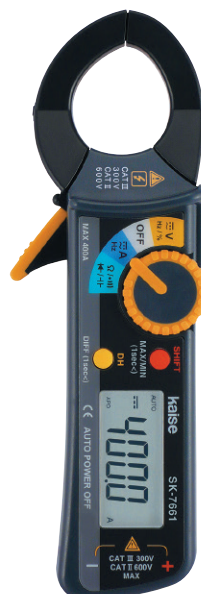
SK-7661 クランプメーター

一般的なサーキットテスターで測定できます。 クランプメーターでも測定できる機種があります。