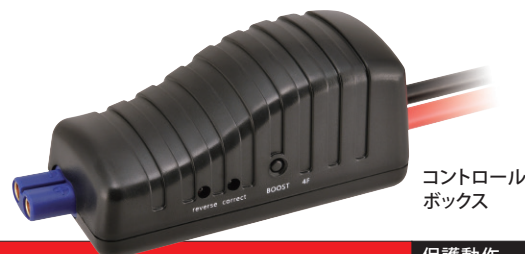
コントロール ボックス

ジャンプスターターに使用されているリチウムイオンバッテリーは、小型・軽量・大出力といった利点がある一方で、使用方法を誤ると下記のような危険性があります。本製品の805ジャンプスタートケーブルのコントロールボックス内に搭載された各保護機能で下記の危険性を未然に防ぎます。